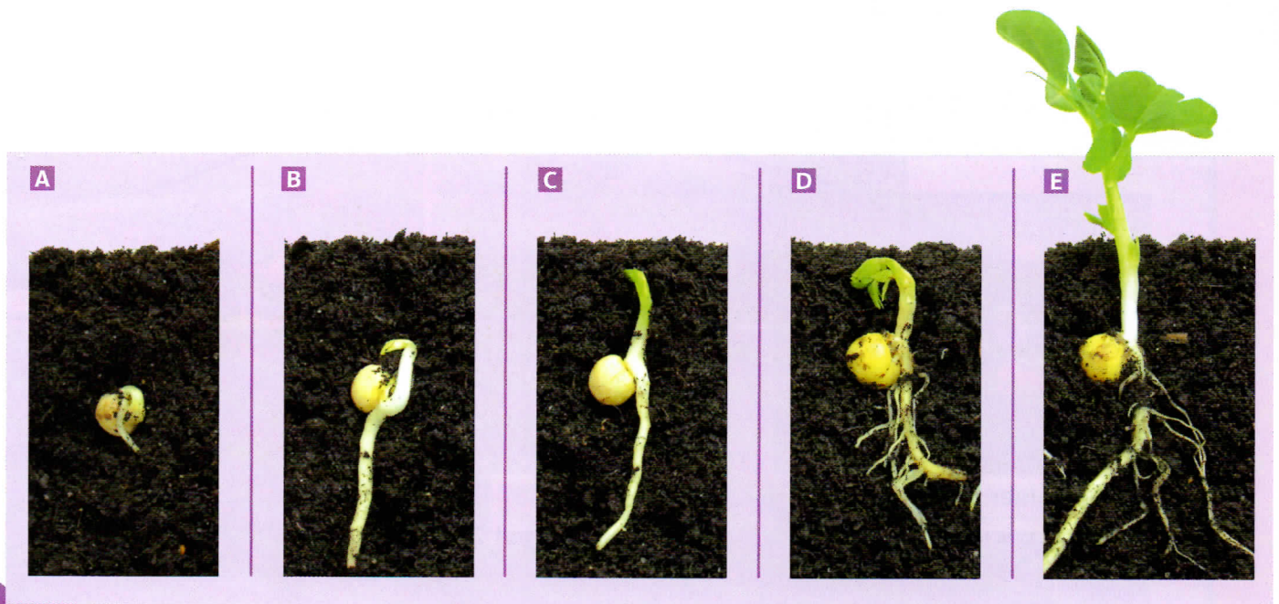
Doc. 1 Les différentes étapes de la germination d'une graine de pois